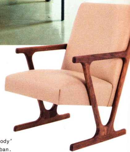
► De 'Woody' van Autoban.