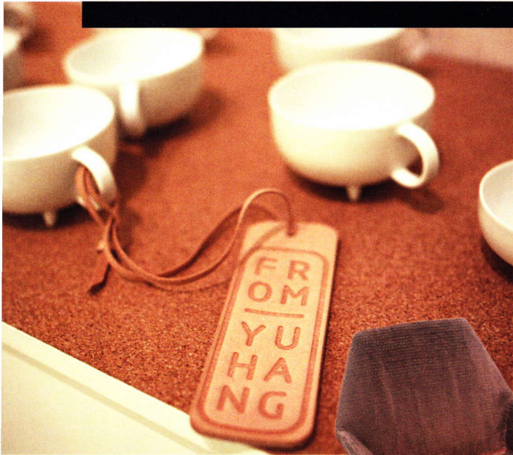
▲ Theeservies van From Yuhang.