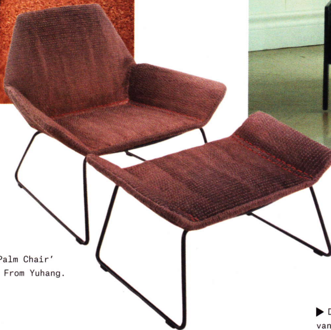
► 'Palm Chair' van From Yuhang.