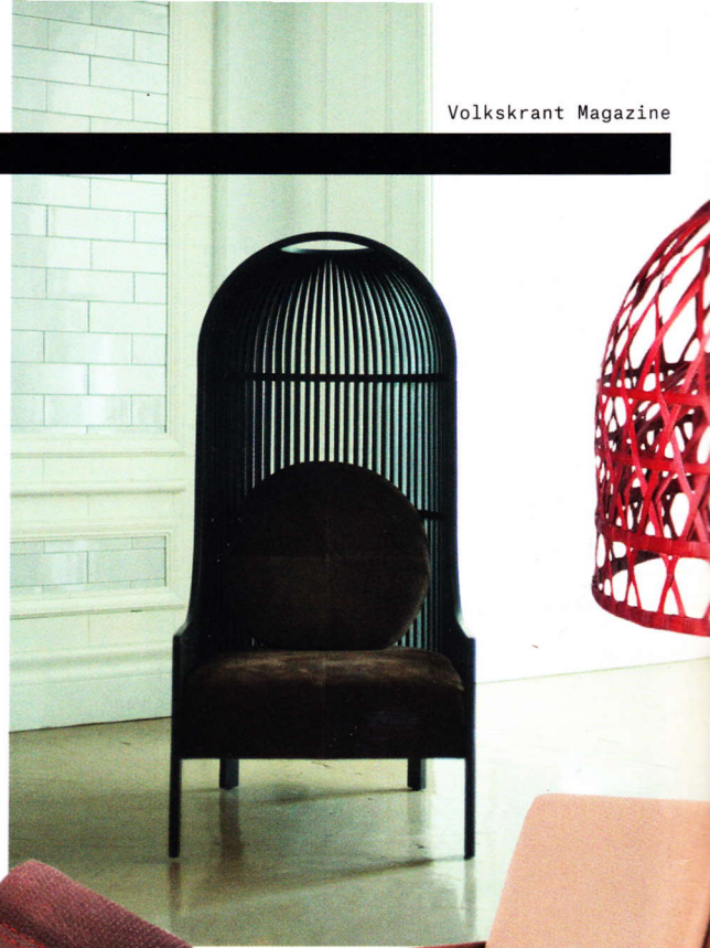
► Stoel 'Nest' van Autoban.