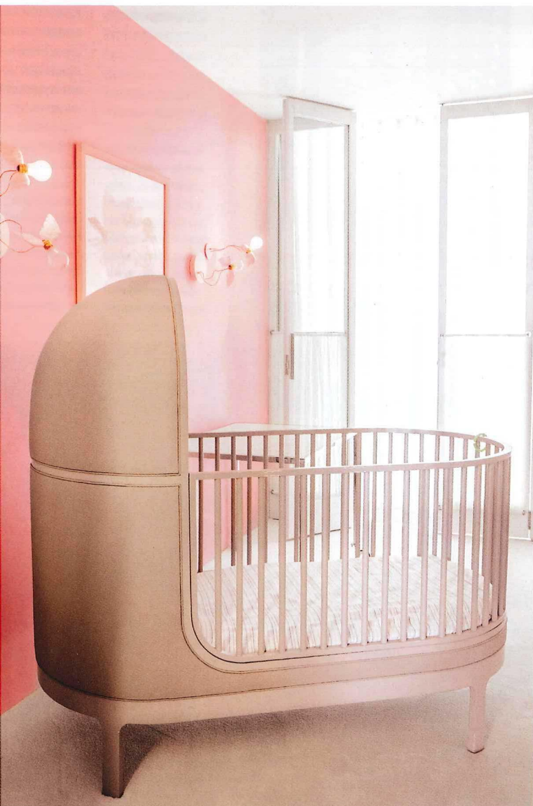
Links Wieg Baby Nest is een ontwerp van Autoban, de lampjes Lucellino aan de muur zijn van Ingo Maurer

'Een huis moet de persoonlijkheid en levensstijl van zijn bewoners weerspiegelen'