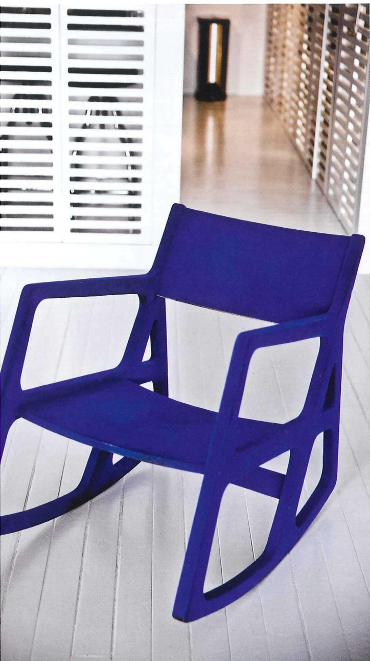
Links Sleepy Rocking Chair van Autoban