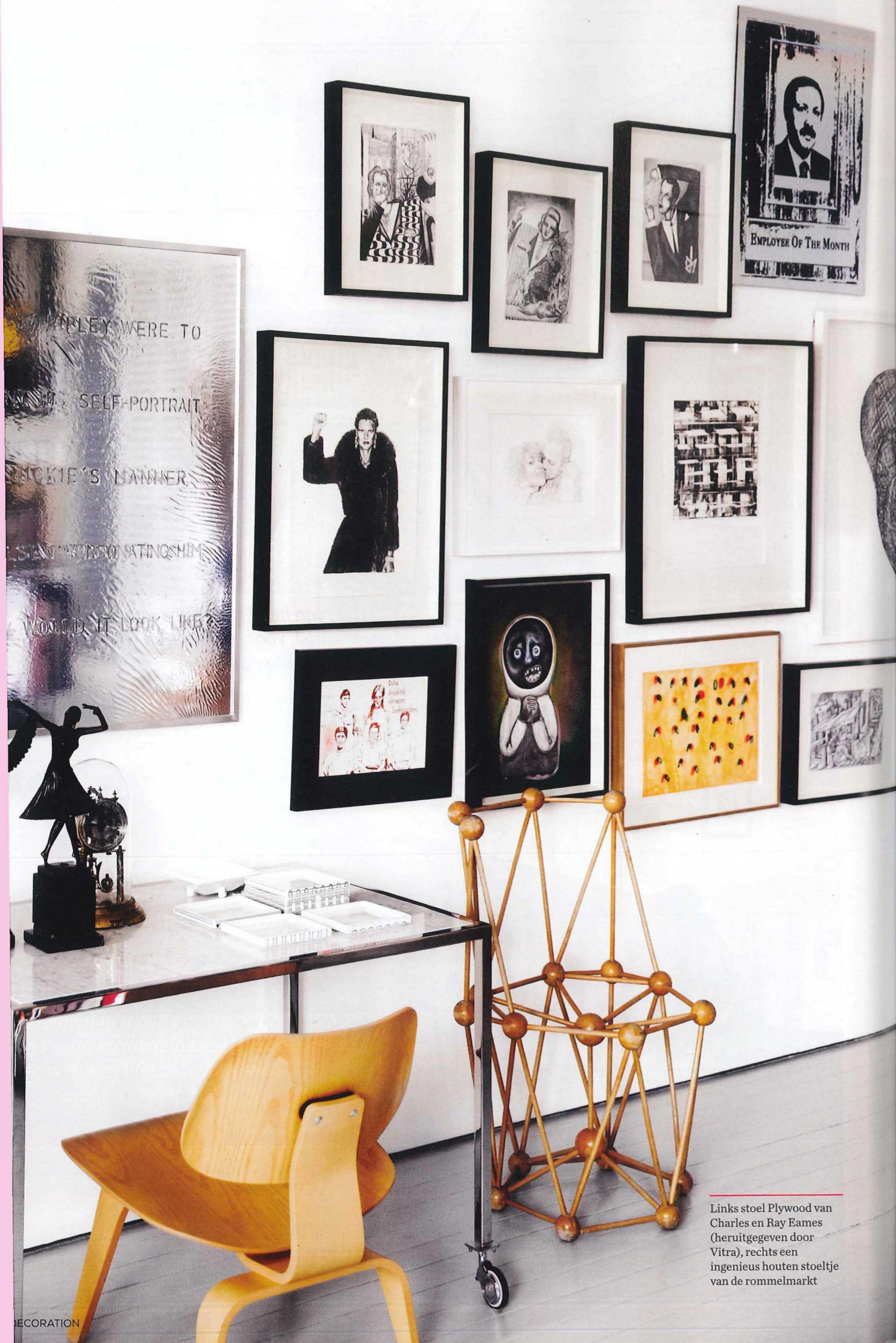
Links stoel Plywood van Charles en Ray Eames (heruitgegeven door Vitra), rechts een ingenieus houten stoeltje van de rommelmarkt