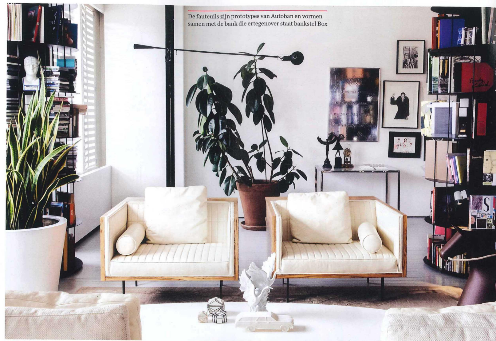
De fauteuils zijn prototypes van Autoban en vormen samen met de bank die ertegenover staat bankstel Box