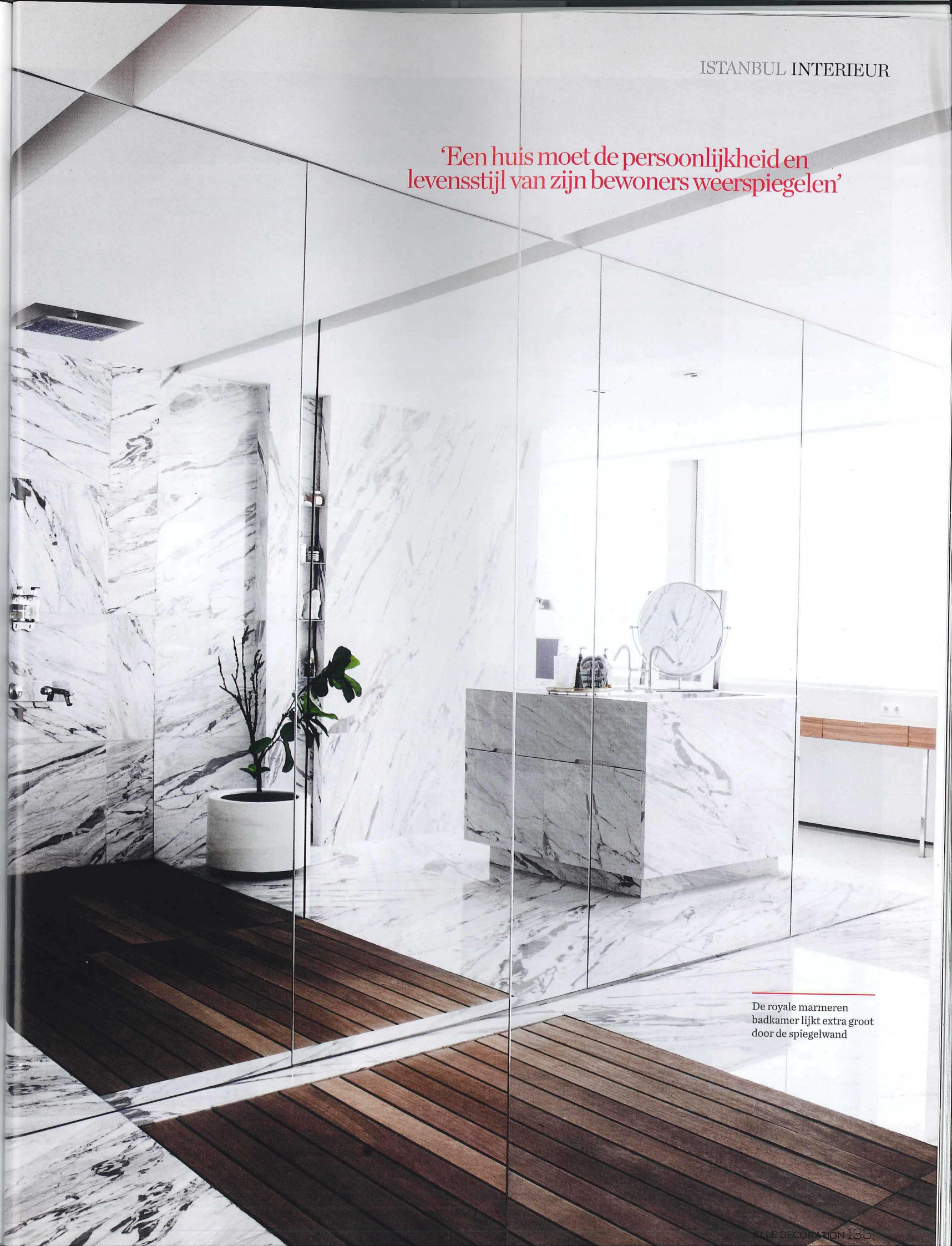
De royale marmeren badkamer lijkt extra groot door de spiegelwand