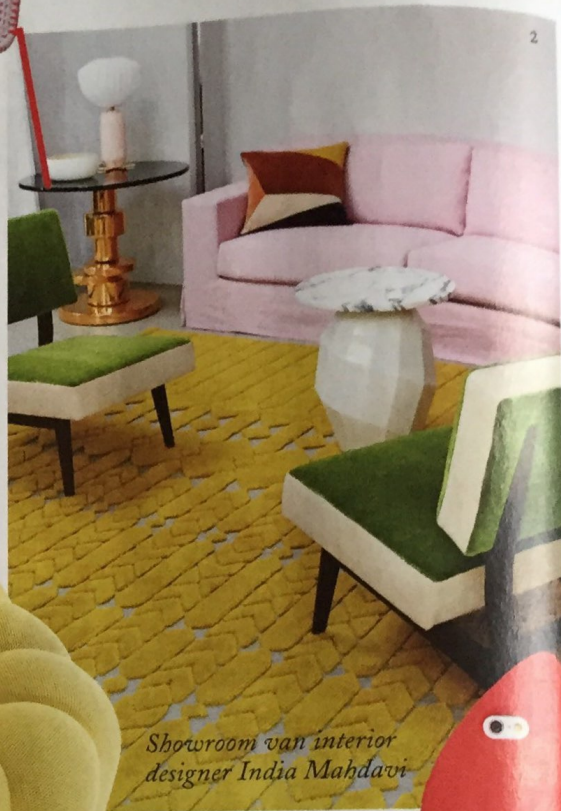
Showroom van interior designer India Mahdavi